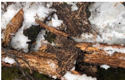
朽ちてモロモロになったサクラの枝