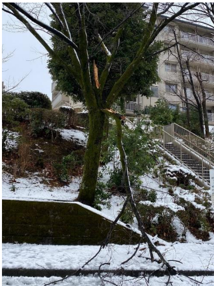
団地入口階段脇 サクラ枝折れ