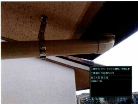
雨樋修復後(5-503号室)写真