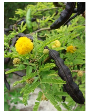
カシーの花、右の黒いのは実

※3. ナポレオン1世の皇后ジョゼフィーヌはバラを愛好し、世界中からバラを取り寄せマルメゾン城のばら園に植栽させる一方、ルドゥーテに「バラ図譜」を描かせた。「バラ図譜」には169種のバラが精密に描かれ、芸術的価値だけではなく植物学上も重要な資料となっている。