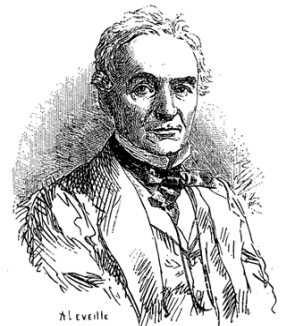
Prosper Mérimé メリメ

小説「カルメン」は、1830年27歳で最初のスペイン旅行中の見聞と、旅行中に知り合って「手厚い歓待」を受けたティエバ伯爵夫人（後のモンティホ伯爵夫人）から聞いた話などが材料。なお、彼女の次女ウジェニーは第2帝政の皇帝ナポレオン3世の妃になったが、メリメと共に伯爵夫人と「交流」のあったアレクサンドル・デュマ・フィス等がこれをバックアップした。