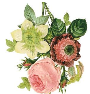
「ばら図譜」に描かれたばらの絵