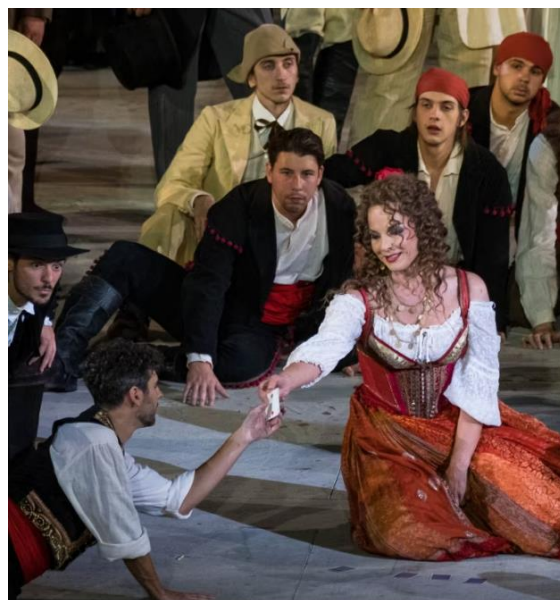
第 1 幕 カルメンが歌う「恋は野の鳥」の場面