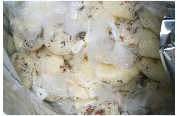
アルファ米を配りました。