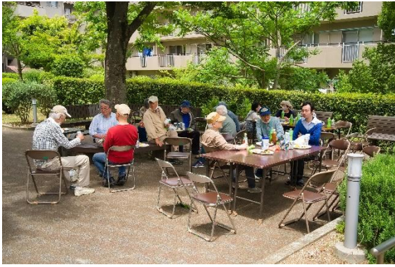
交流会の写真 お疲れ様でした カンパイ！