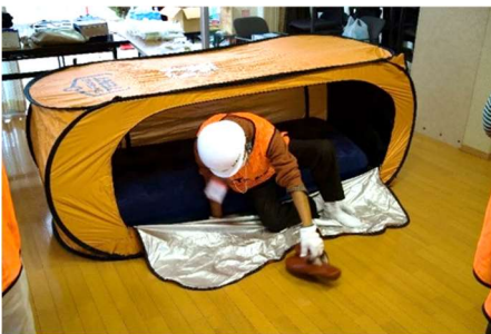
カプセルテント ～プライバシーが保たれます～