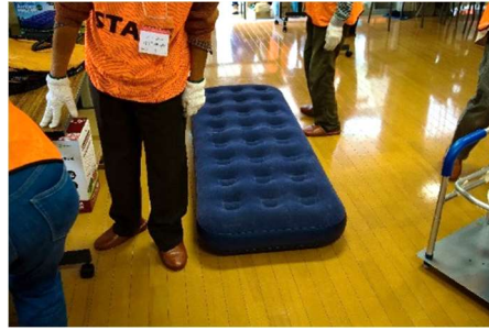
エアベッド ～中々の寝心地～