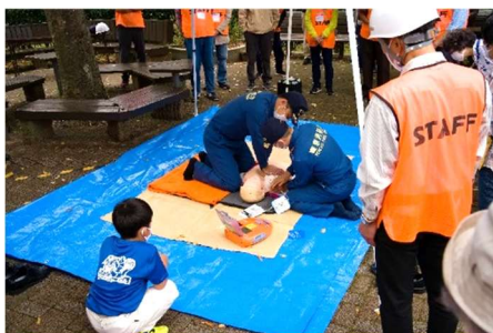
AEDの使い方を消防署員がお手本