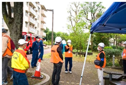
『自衛消防訓練の開催を宣言します。』