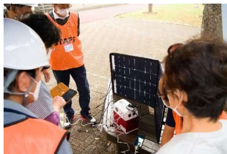
ソーラーパネルを使ってスマホの充電