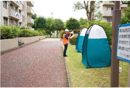
『これから自主防災訓練をします。』