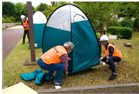
カプセルテント設営中