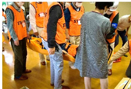
キャリーマット使用実演