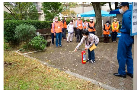
まずは消火器の使い方から