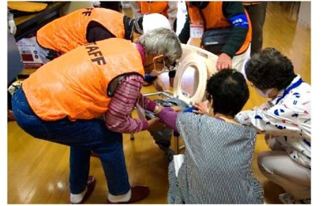
マンホールトイレの組み立て