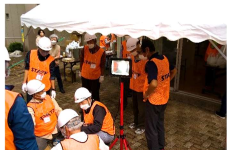
発電機の起動訓練とスタンドライトのテスト