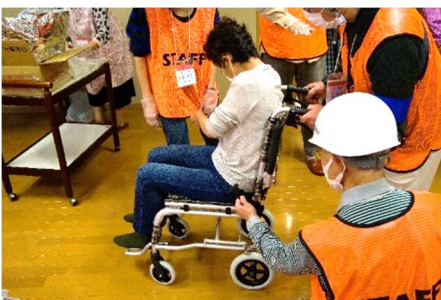
備品の車いすです