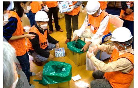
水に凝固剤を混ぜて疑似体験