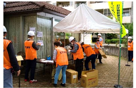
お持ち帰りいただく長期保存水、クッキーなど準備