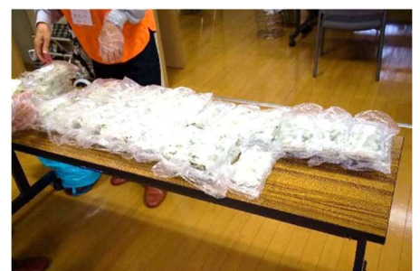
美味しくいただきました