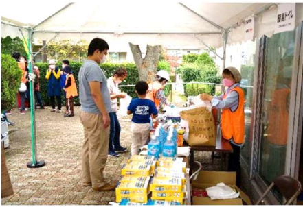
お土産お持ち帰り下さい