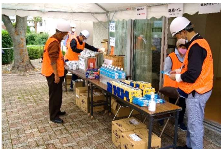
参加者にプレゼントする防災グッズを並べます