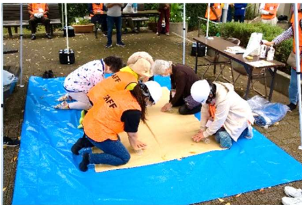
ペットボトルを使って心肺蘇生の訓練です