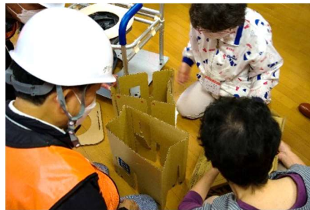
段ボールトイレの組み立て ～超難しい～