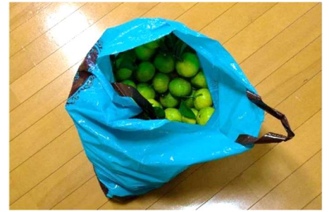
当団地で採れたみかんもおすそ分け