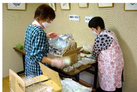
わかめごはんを小分けにしています