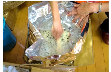
アルファ米のわかめごはんを準備しています