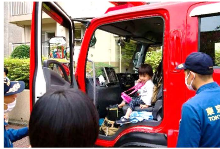
消防車に乗れたよ