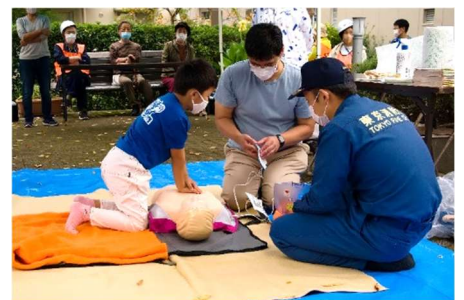
お子様も参加いただきました