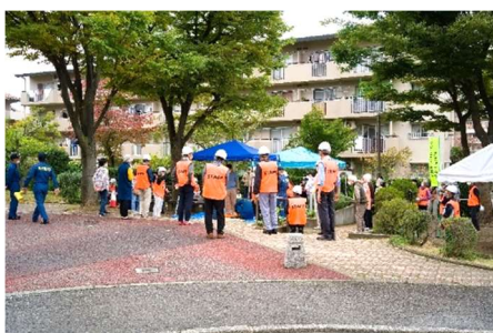
自衛消防訓練は無事終了しました