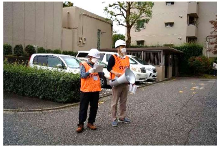
【うぐいす隊】自衛消防訓練の呼び込み