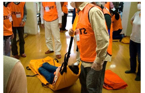
一人の時は肩にかけて引っ張ります