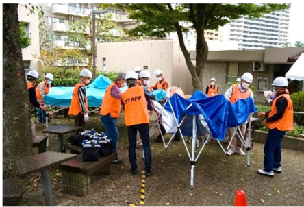
テントの組み立て ～チームワークの見せ所～