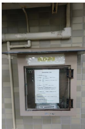
( BOX正面 )