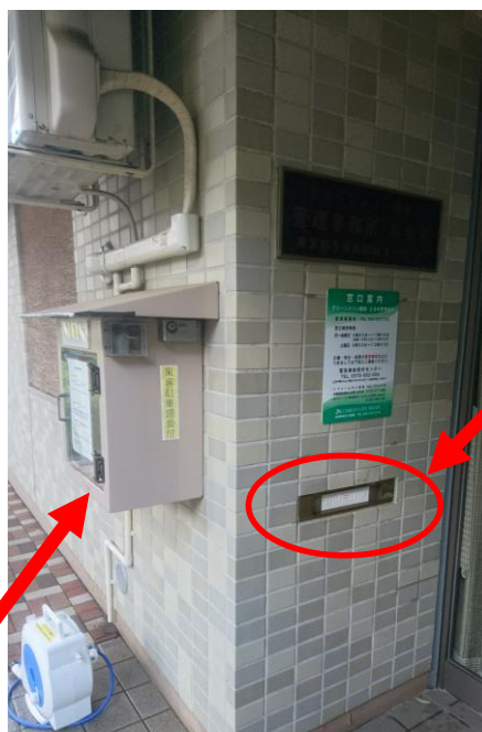
管理事務所のポスト