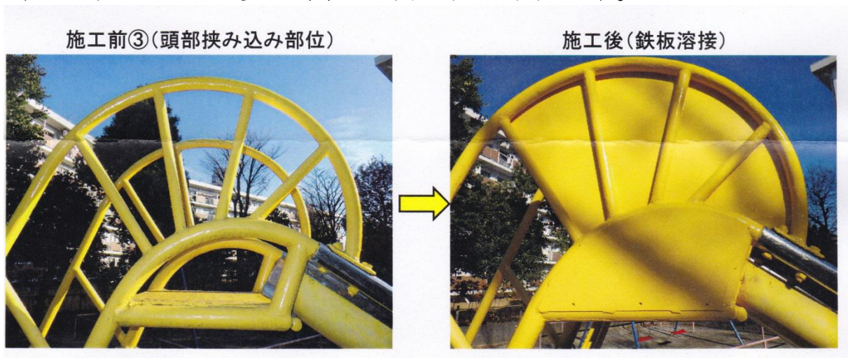
すべり台の安全対策(例)

この点検結果を踏まえ、施工業者と内容について協議し、来年度予算を取り、対策を実施します。