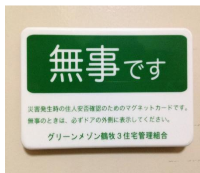
↑安否確認マグネット

毎年二回実施しております、災害対策本部立ち上げ訓練を、今年も二回目を実施する事となりました。今回新たな取り組みとして、戸別の安否確認を実施いたします。安否確認は、災害対策本部立ち上げ時、早急に行わなければならない重要事項であり、今後対策本部がどのようにあるべきかを検討する上でも重要な項目の一つです。住民の皆様には、重要性をご理解いただき、是非ご協力をお願いいたします。