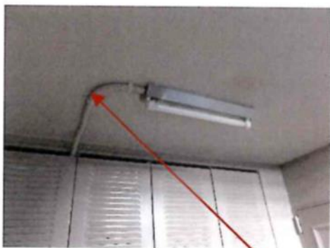
※3-301・2玄関前天井照明

建築設備点検で不具合を指摘されていた、301、302号室の階段共用蛍光灯より電源を供給していたVDSLの電源経路(写真左下)を、103、104号室メータボックス内の分電盤より供給する配線が完了した。